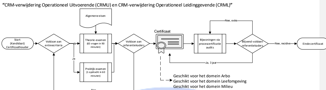
Figuur 1: Flowchart Primair proces

Het middels een theorie-examen en praktijk-examen , “CRM-verwijdering Operationeel Uitvoerende of CRM-verwijdering Operationeel Leidinggevende” examen, aantoonbaar maken van de specifieke deskundigheid van een natuurlijk persoon om zelfstandig (bouw-)materialen in bouwwerken en objecten te kunnen verwijderen.